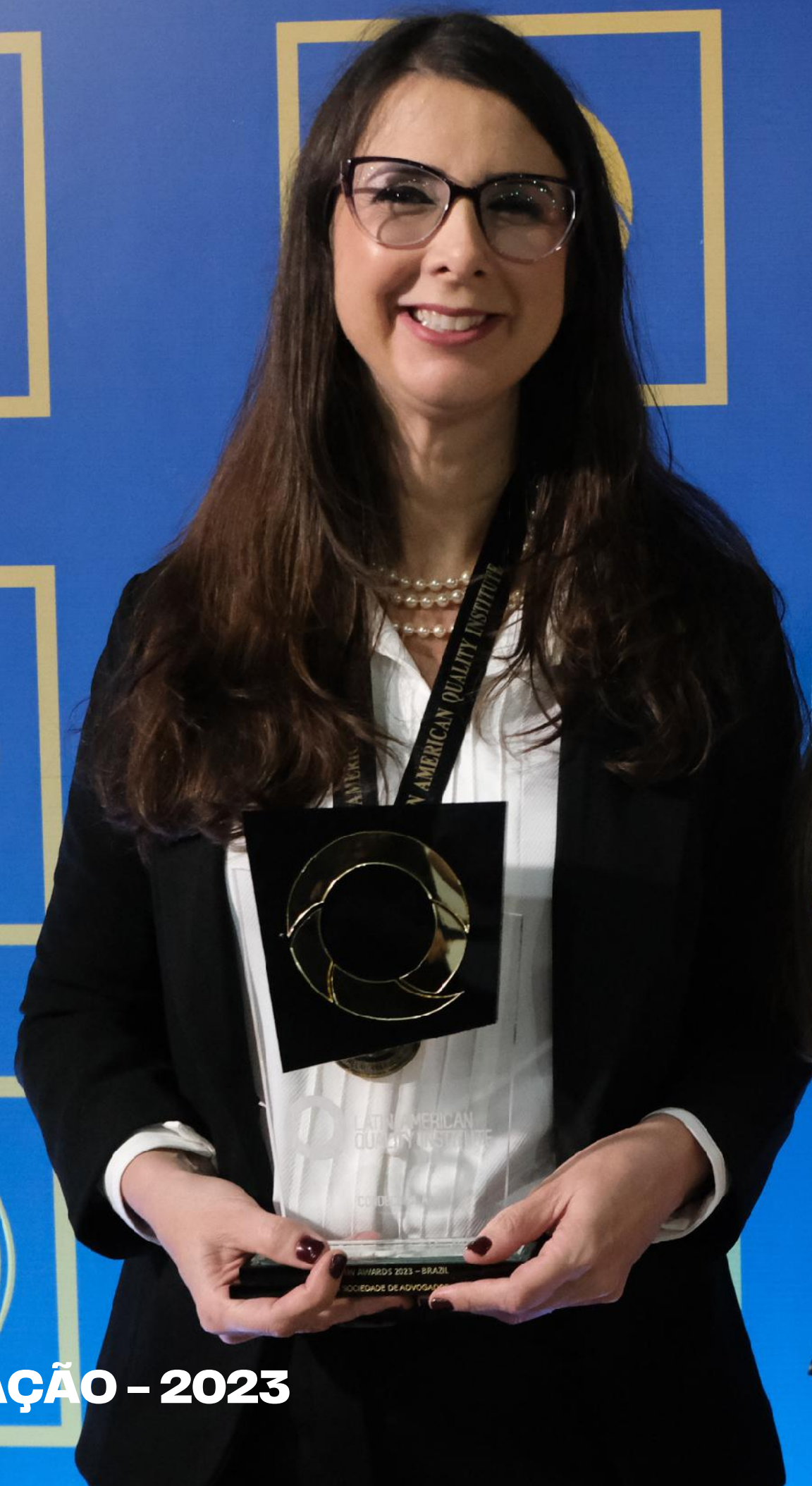
FOTOGRAFIAS CERIMÔNIA DE PREMIAÇÃO - 2023