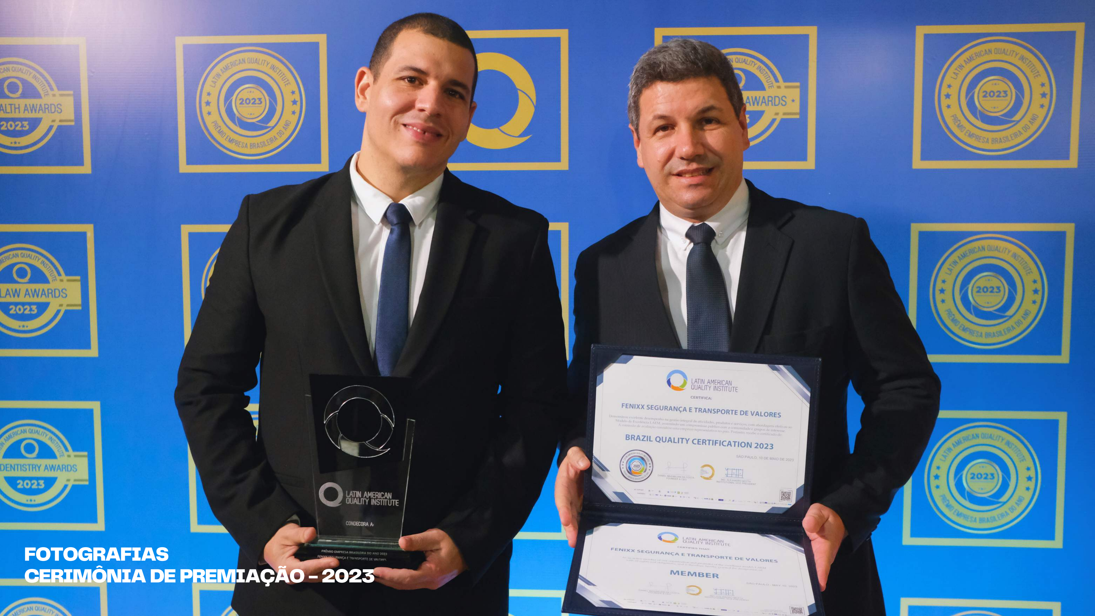
FOTOGRAFIAS CERIMÔNIA DE PREMIAÇÃO - 2023