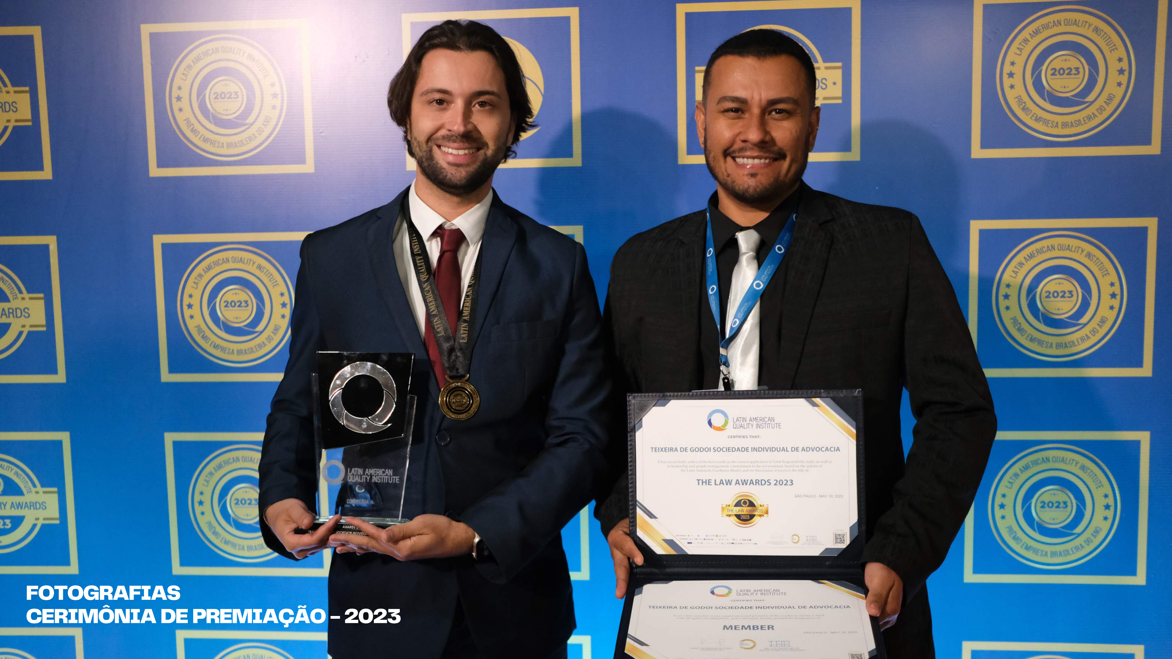
FOTOGRAFIAS CERIMÔNIA DE PREMIAÇÃO – 2023

LATIN AMERICAN QUALITY INSTITUTE CERTIFIES THAT: TEIXEIRA DE GODOI SOCIEDADE INDIVIDUAL DE ADVOCACIA It has successfully achieved the best results in the correct application of Total Responsibility tools, as well as in leadership and people management, commitment to the environment, based on the actions of the Latin American Excellence Model, and for this reason, it receives the title of THE LAW AWARDS 2023 SÃO PAULO - MAY 10, 2023