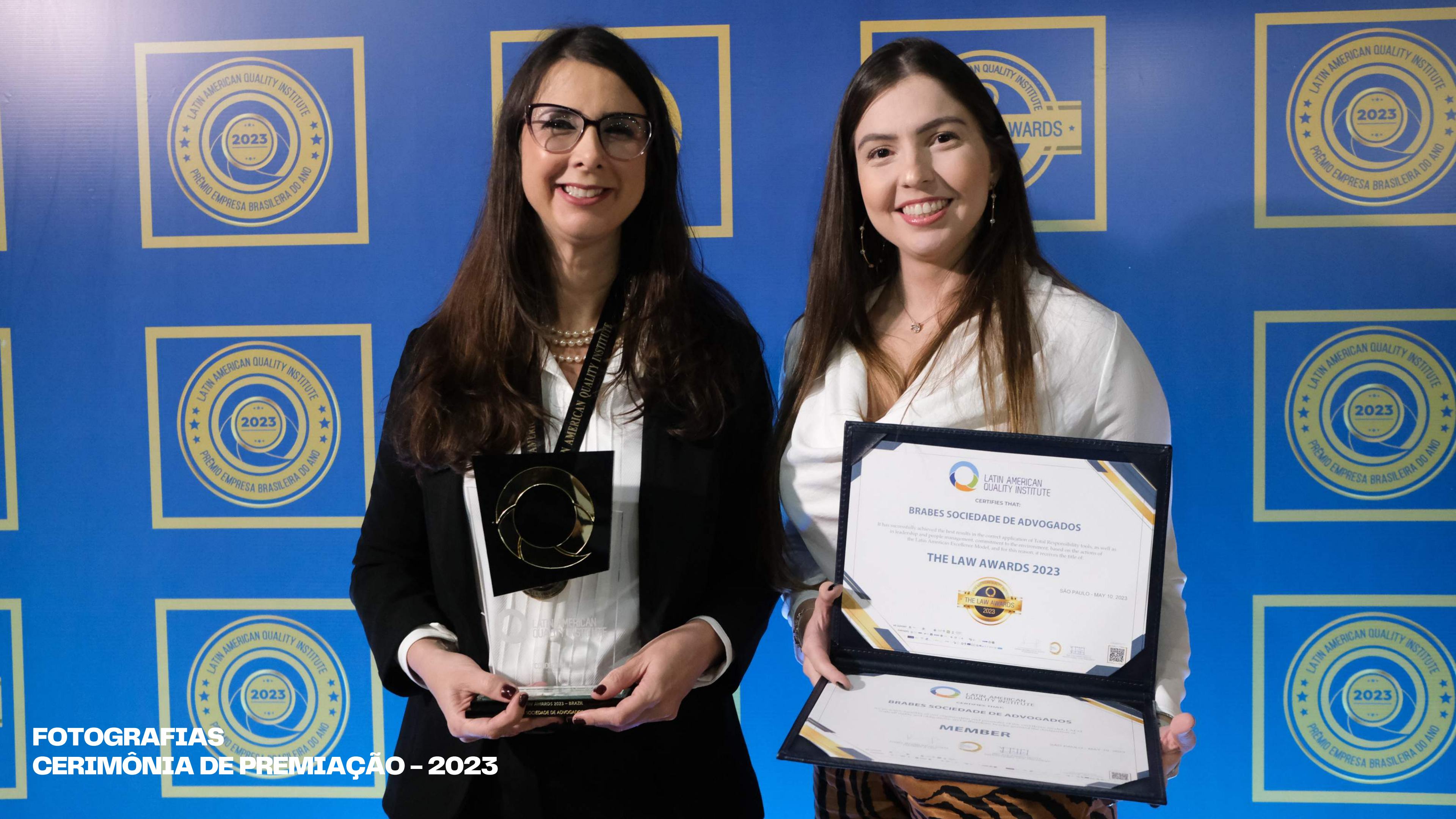
FOTOGRAFIAS CERIMÔNIA DE PREMIAÇÃO - 2023

LATIN AMERICAN QUALITY INSTITUTE CERTIFIES THAT: BRABES SOCIEDADE DE ADVOGADOS It has successfully achieved the best results in the correct application of Total Responsibility tools, as well as in leadership and people management, commitment to the environment, based on the actions of the Latin American Excellence Model, and for this reason, it receives the title of: THE LAW AWARDS 2023 SÃO PAULO - MAY 10, 2023 LATIN AMERICAN QUALITY INSTITUTE CERTIFIES THAT: BRABES SOCIEDADE DE ADVOGADOS MEMBER