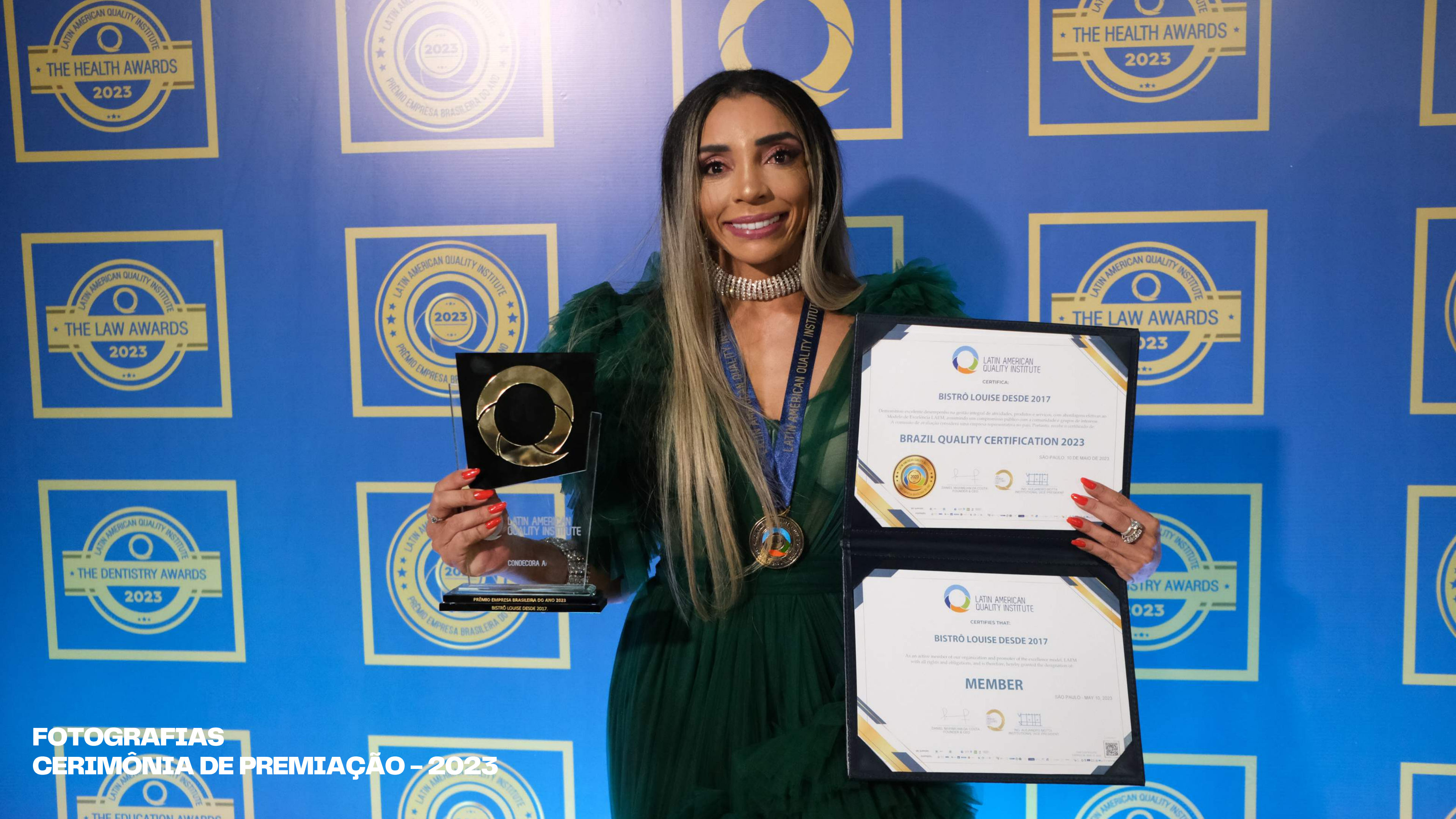
FOTOGRAFIAS CERIMÔNIA DE PREMIAÇÃO – 2023