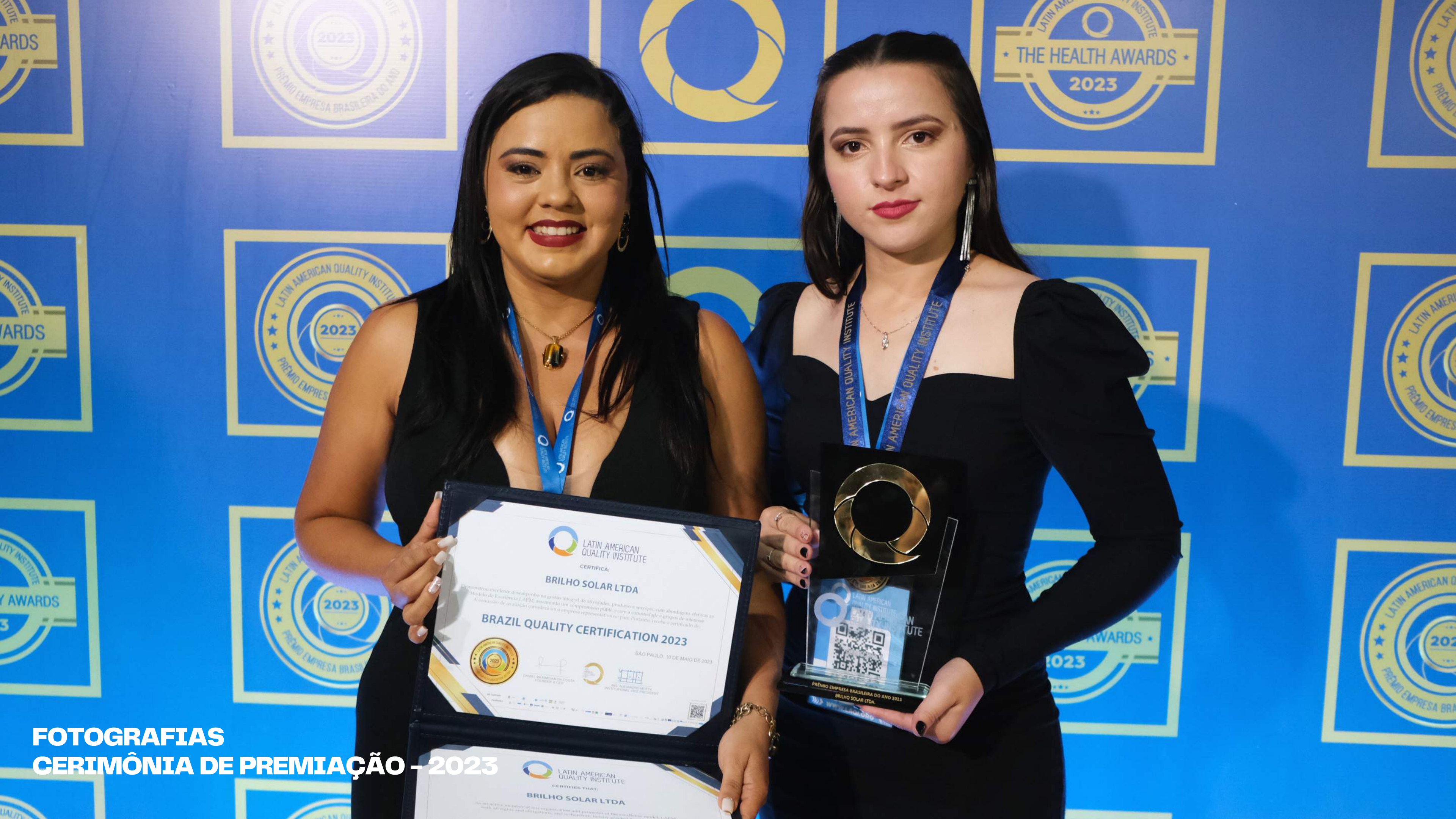
FOTOGRAFIAS CERIMÔNIA DE PREMIAÇÃO – 2023