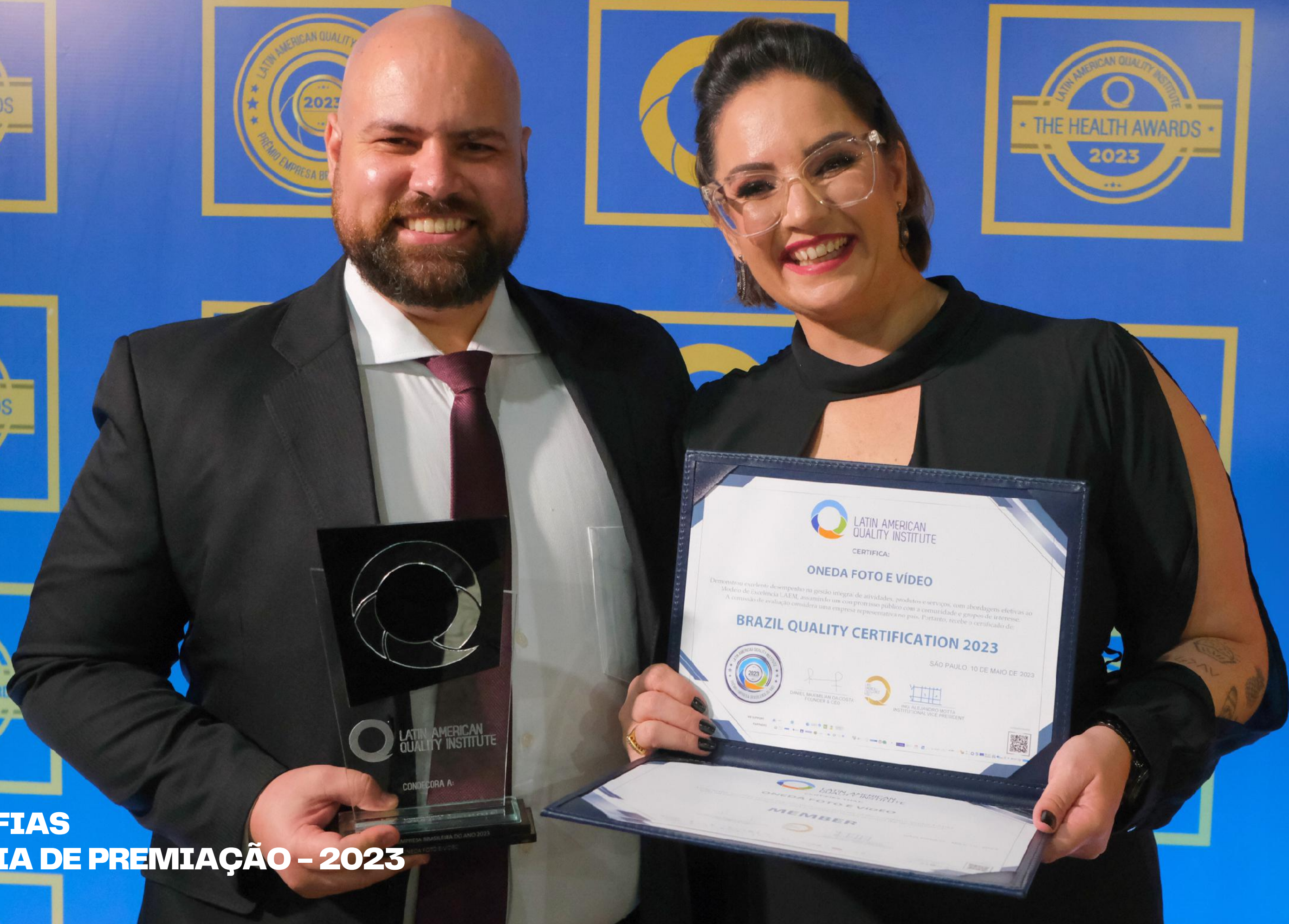
FOTOGRAFIAS CERIMÔNIA DE PREMIAÇÃO - 2023