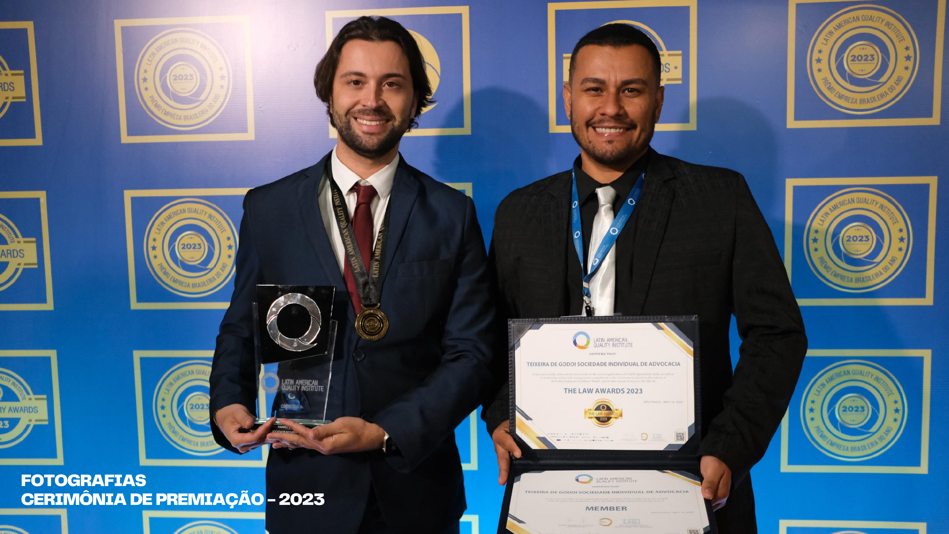
FOTOGRAFIAS CERIMÔNIA DE PREMIAÇÃO – 2023

LATIN AMERICAN QUALITY INSTITUTE CERTIFIES THAT: TEIXEIRA DE GODOI SOCIEDADE INDIVIDUAL DE ADVOCACIA It has successfully achieved the best results in the correct application of Total Responsibility tools, as well as in leadership and people management, commitment to the environment, based on the actions of the Latin American Excellence Model, and for this reason, it receives the title of: THE LAW AWARDS 2023 SÃO PAULO – MAY 10, 2023