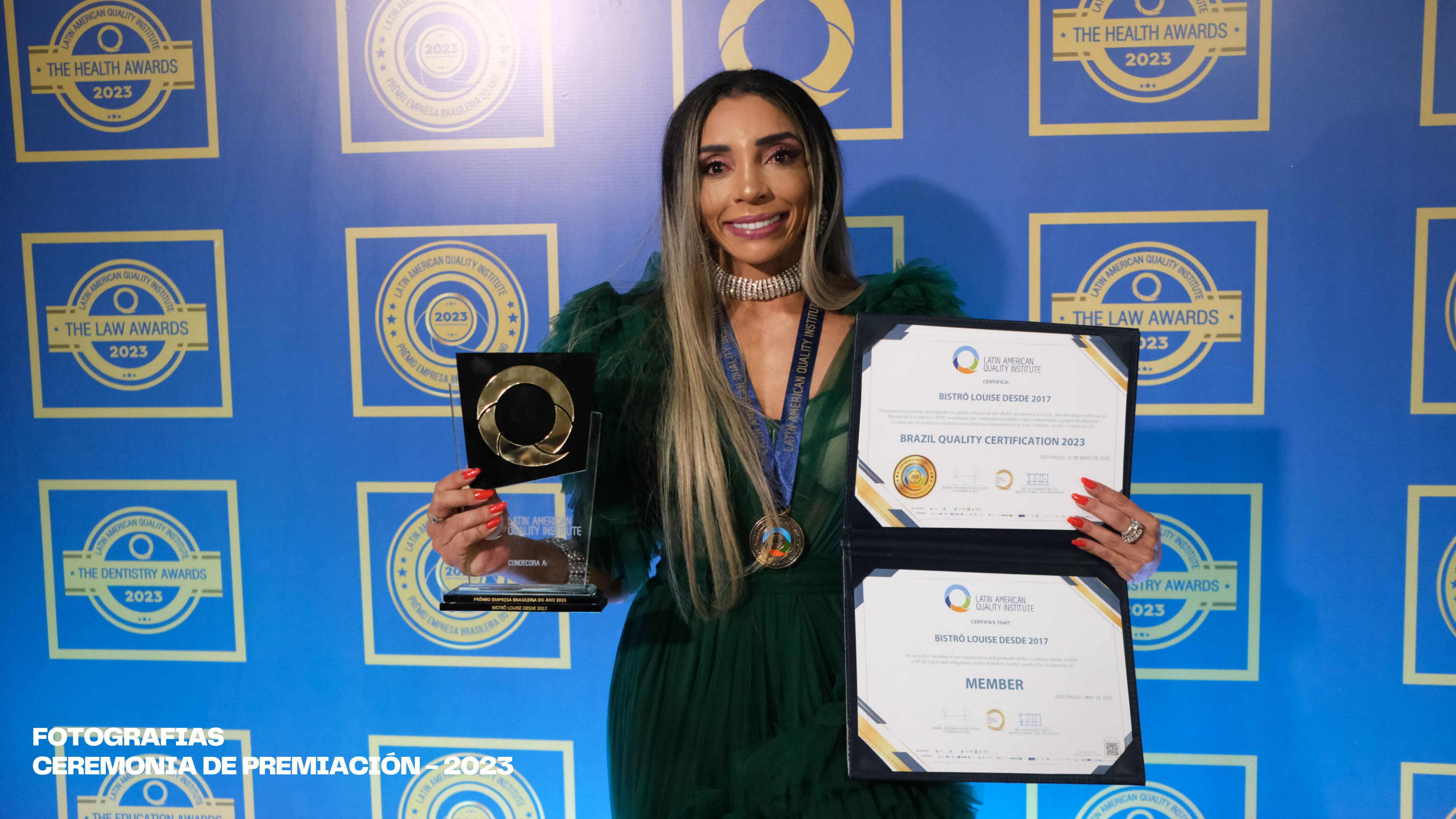
FOTOGRAFIAS CEREMONIA DE PREMIACIÓN - 2023