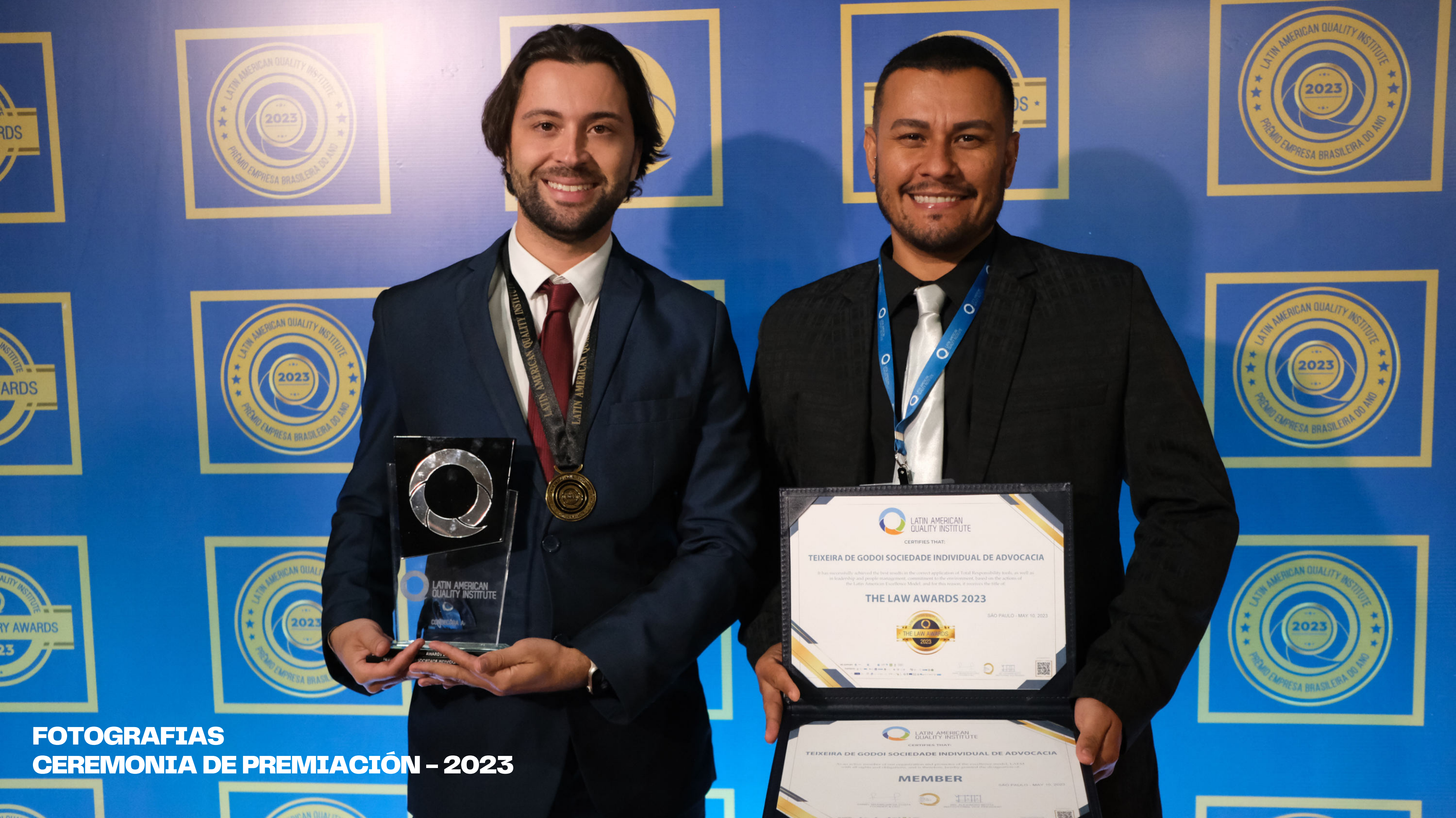
FOTOGRAFIAS CEREMONIA DE PREMIACIÓN – 2023

LATIN AMERICAN QUALITY INSTITUTE CERTIFIES THAT: TEIXEIRA DE GODOI SOCIEDADE INDIVIDUAL DE ADVOCACIA It has successfully achieved the best results in the correct application of Total Responsibility tools, as well as in leadership and people management, commitment to the environment, based on the actions of the Latin American Excellence Model, and for this reason, it receives the title of: THE LAW AWARDS 2023 SÃO PAULO - MAY 10, 2023