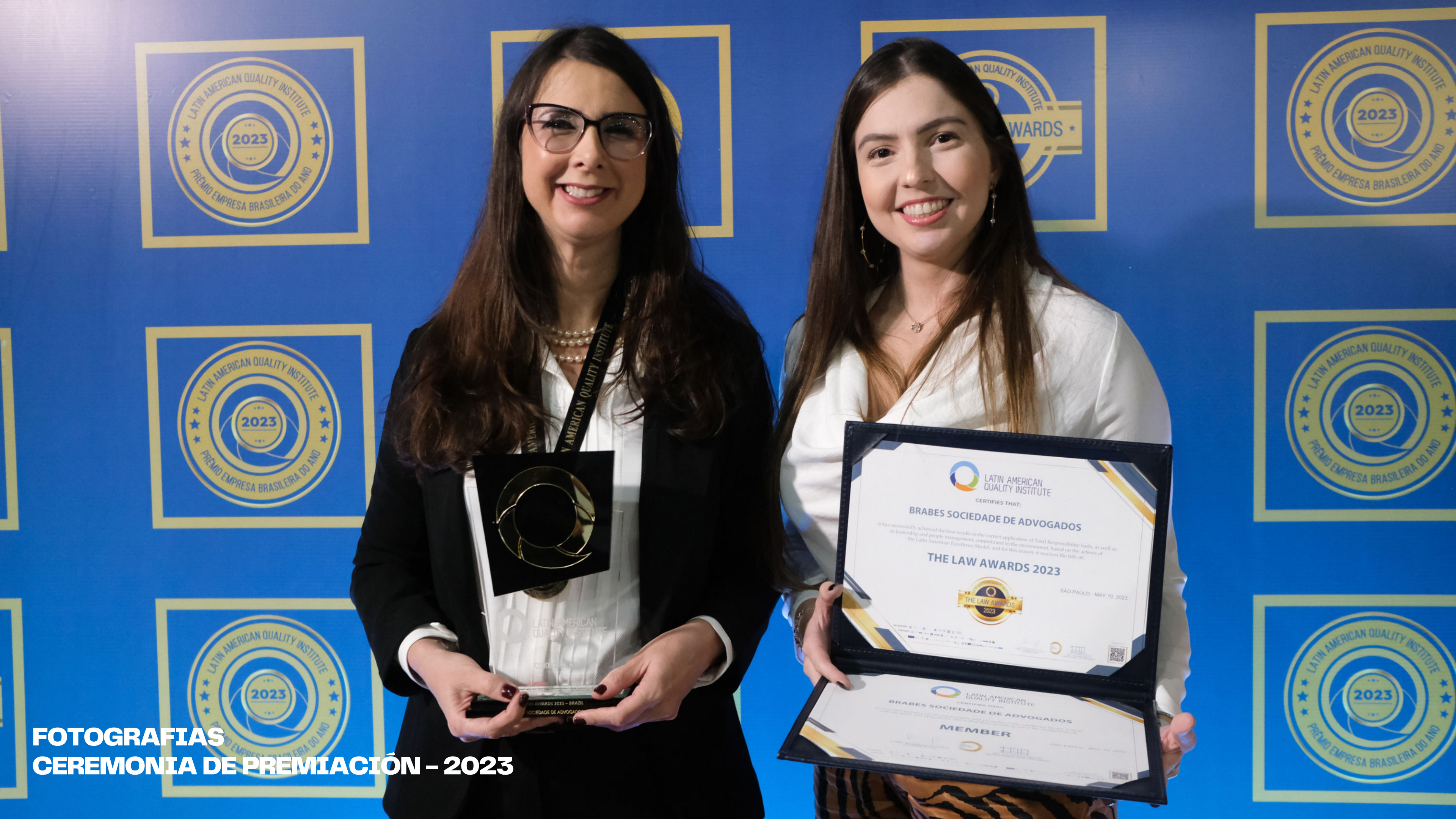
FOTOGRAFIAS CEREMONIA DE PREMIACIÓN – 2023

LATIN AMERICAN QUALITY INSTITUTE CERTIFIES THAT: BRABES SOCIEDADE DE ADVOGADOS It has successfully achieved the best results in the correct application of Total Responsibility tools, as well as in leadership and people management, commitment to the environment, based on the actions of the Latin American Excellence Model, and for this reason, it receives the title of: THE LAW AWARDS 2023 SÃO PAULO - MAY 10, 2023 LATIN AMERICAN QUALITY INSTITUTE CERTIFIES THAT: BRABES SOCIEDADE DE ADVOGADOS MEMBER