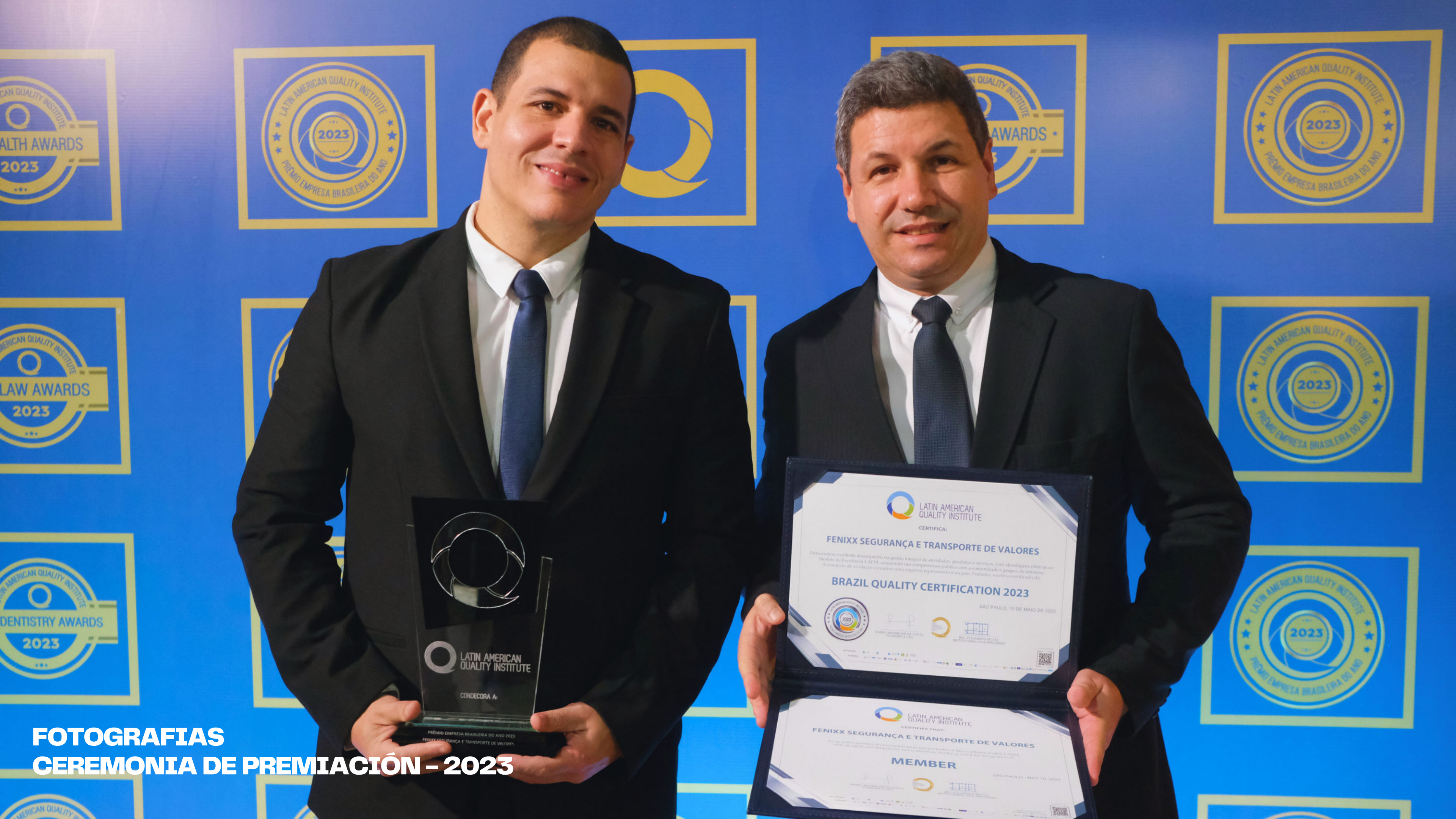
FOTOGRAFIAS CEREMONIA DE PREMIACIÓN - 2023